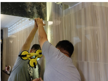
กระจกเงา