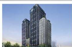
เอ็กซ์ที พญาไท