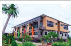
แกรนด์ซีรีส์ รีสอร์ท เขาใหญ่