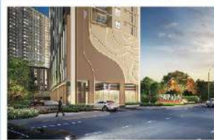
ศุภาลัย วาเรนดา ภาชีเจริญ