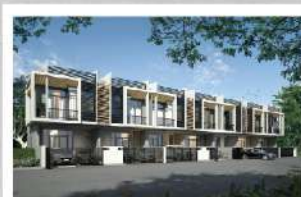
ไมทาวน์ ไทท์ ชัยพฤกษ์