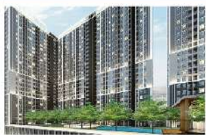
เดอะ รีเจนท์ บางซื่อ