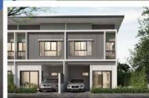
เดอะโมดิช ชัยพฤกษ์-วงแหวน