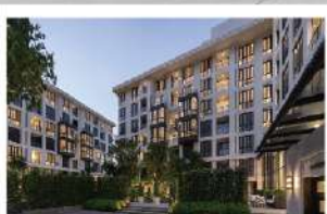
เดอะ ซีเนฟ สุนทรวิถ์ 61