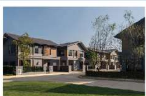
อนาสีริ รังสิต