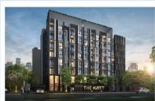
เดอะ แมก สุนทรวิถ์ 101/1