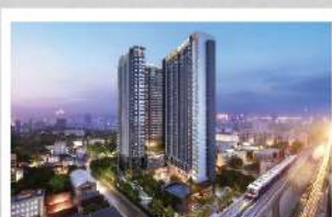
เดอะ โพรเจ็คท์ เพชรเกษม 62