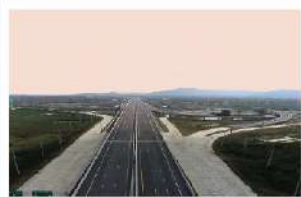
มอเดิร์นเวย์ บางปะอิน-โคราช ช่วงสระบุรี