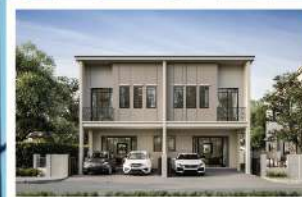
ชวนชื่น ทาวน์ วิลเลจ บางนา