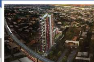
เดอะทรี จรัญสนิทวงศ์ 30