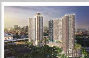
ศุภาลัย เวอเรนด้า สถานีภาชีเจริญ