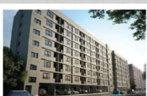
คอนโดเลต รังสิต 36