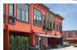
สิริ เฟส บางนา-สุวรรณภูมิ