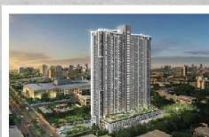
ศุภาลัย ลอฟท์ ตลาดพลู