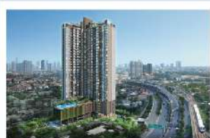
ศุภาลัย ลอฟท์ สาทร-ราชพฤกษ์