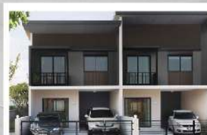
เมททาวน์ บางนา