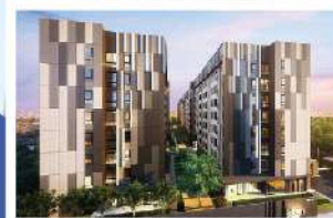
พลัม พรีเมียม พหลโยธิน 89