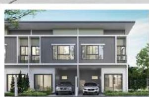
เดอะ โมดิช บางบัวทอง