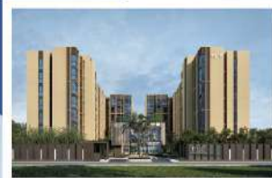
นิว โนเบิล เซ็นเตอร์ บางนา